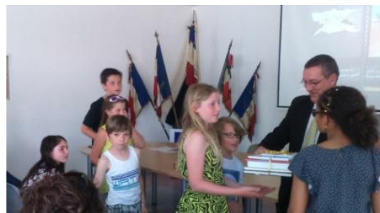
Quelques élèves de CM recevant le 2 ème prix du concours.

Parallèlement, les élèves de CM1-CM2 ont participé à un concours organisé par l'ONAC (Office National des Anciens Combattants) de la Vendée concernant leurs recherches sur les anciens combattants bernardais de la 1 ère guerre mondiale. Leur travail a été récompensé puisqu'ils sont arrivés deuxième et ont eu le privilège de recevoir une dizaine de livres ainsi qu'un chèque de 200 euros. Félicitons ces élèves bernardais pour leur beau travail !