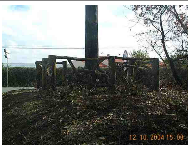
Le repère est au centre de la photo

Remarques : Exploitable par GPS depuis une station excentrée