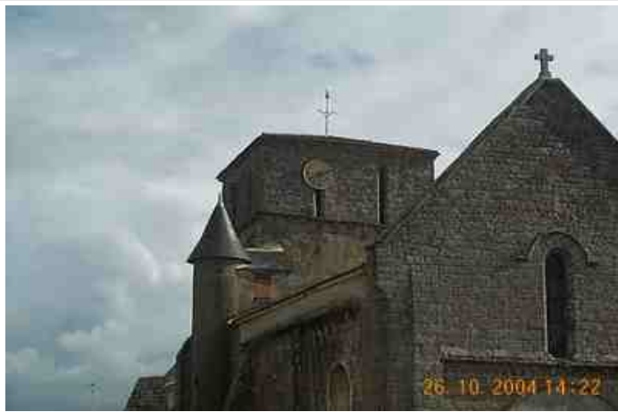
Azimut de la prise de vue : 148 gr